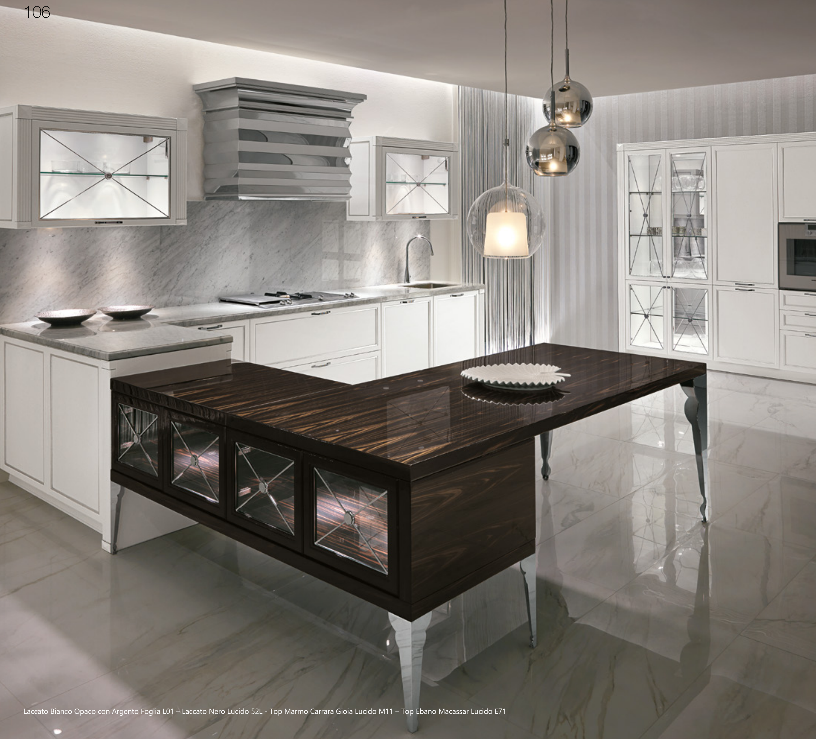
Laccato Bianco Opaco con Argento Foglia L01 – Laccato Nero Lucido 52L - Top Marmo Carrara Gioia Lucido M11 – Top Ebano Macassar Lucido E71