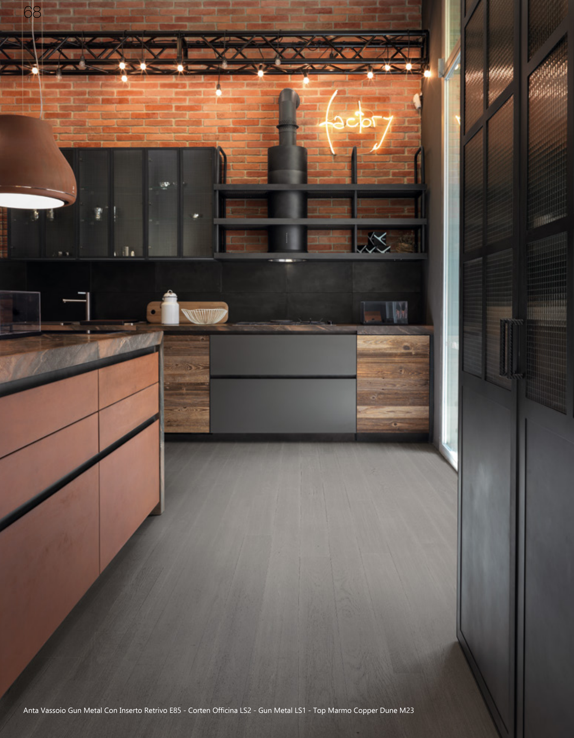
Anta Vassoio Gun Metal Con Insetto Retrivo E85 - Corten Officina LS2 - Gun Metal LS1 - Top Marmo Copper Dune M23