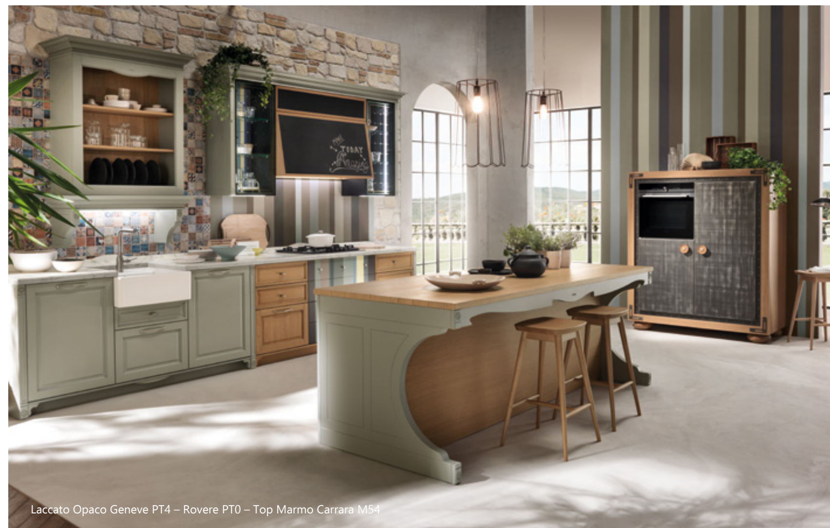
Laccato Opaco Geneve PT4 – Rovere PT0 – Top Marmo Carrara M54