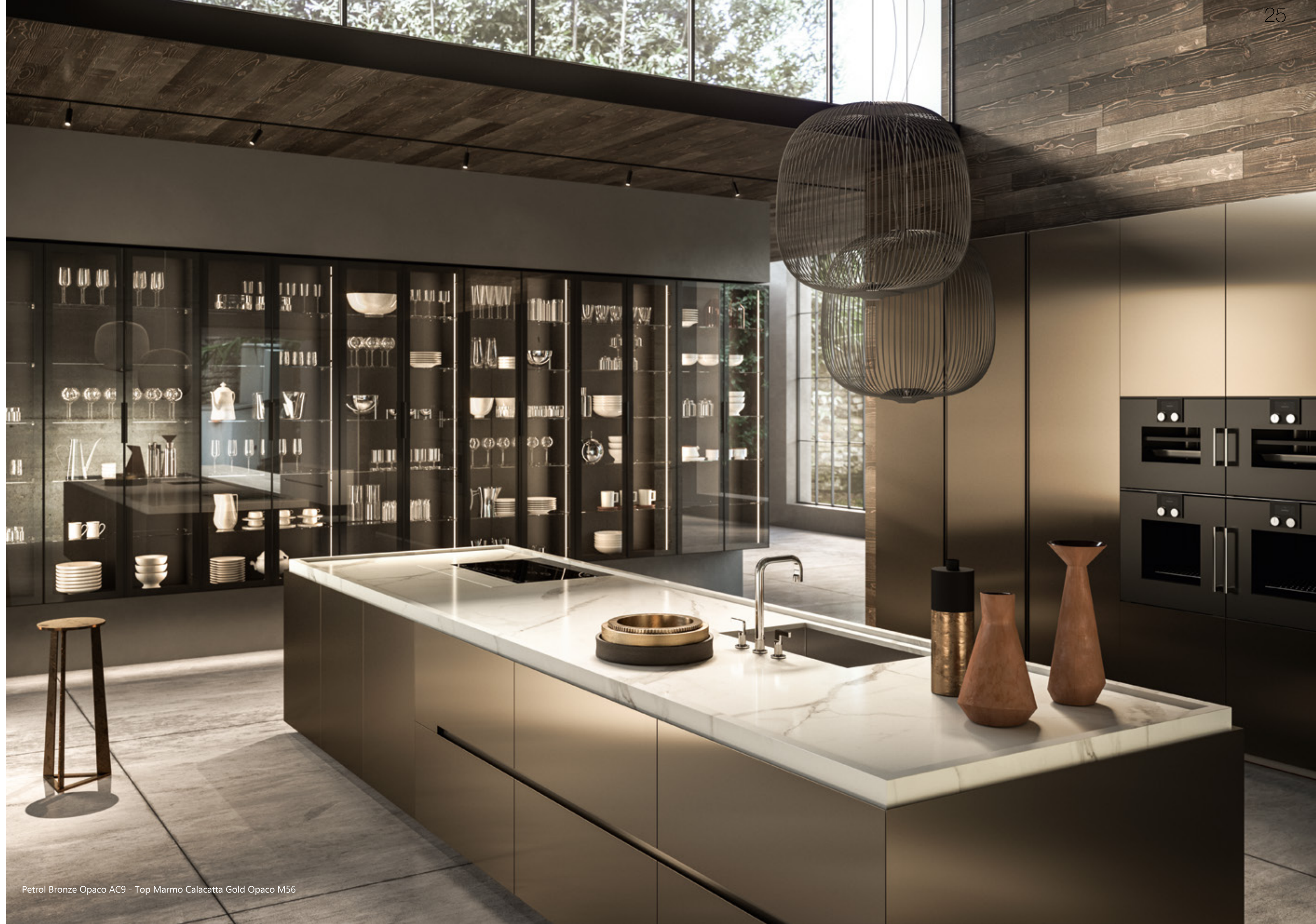
Petrol Bronze Opaco AC9 - Top Marmo Calacatta Gold Opaco M56