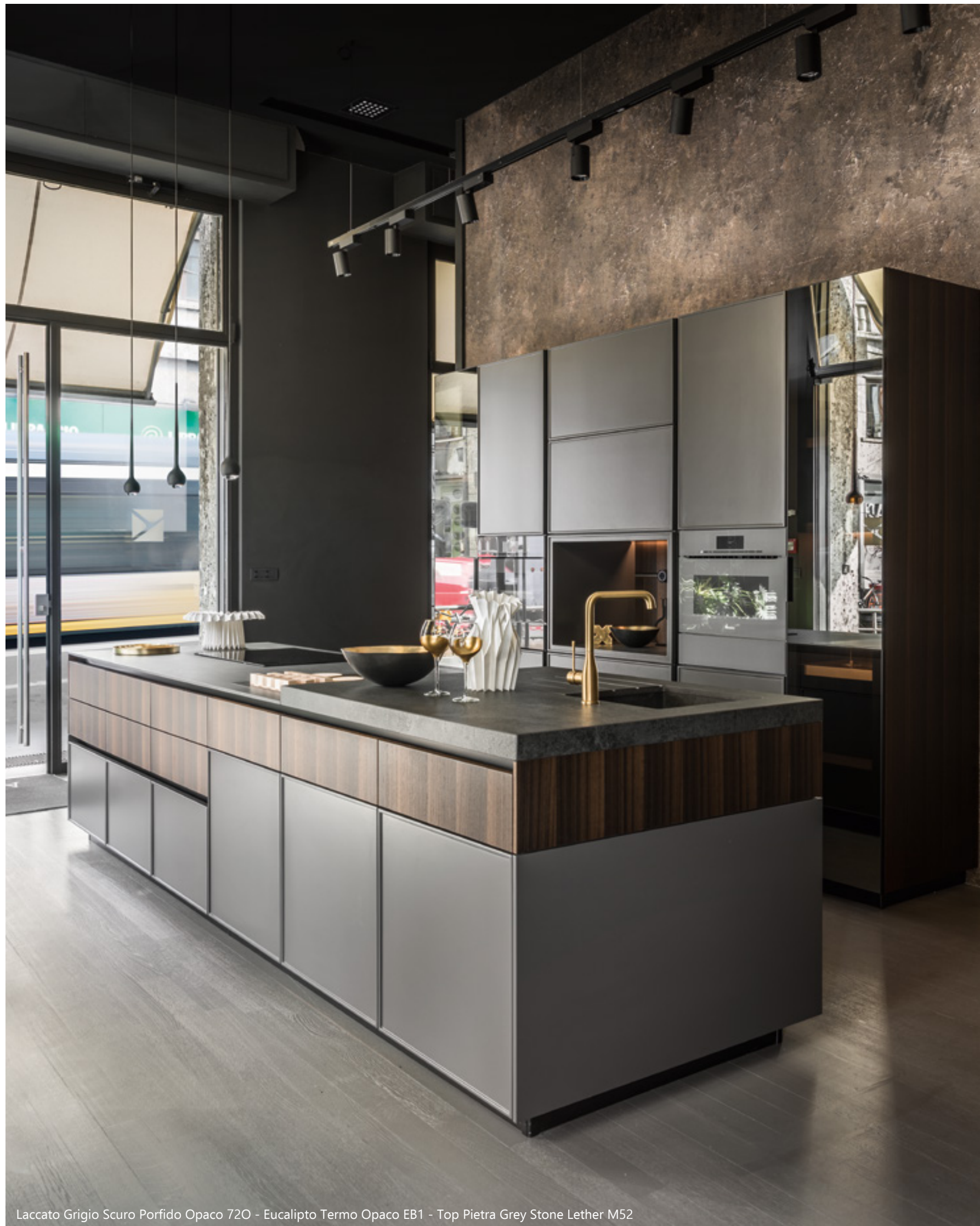
Laccato Grigio Scuro Porfido Opaco 720 - Eucalipto Termo Opaco EB1 - Top Pietra Grey Stone Lether M52