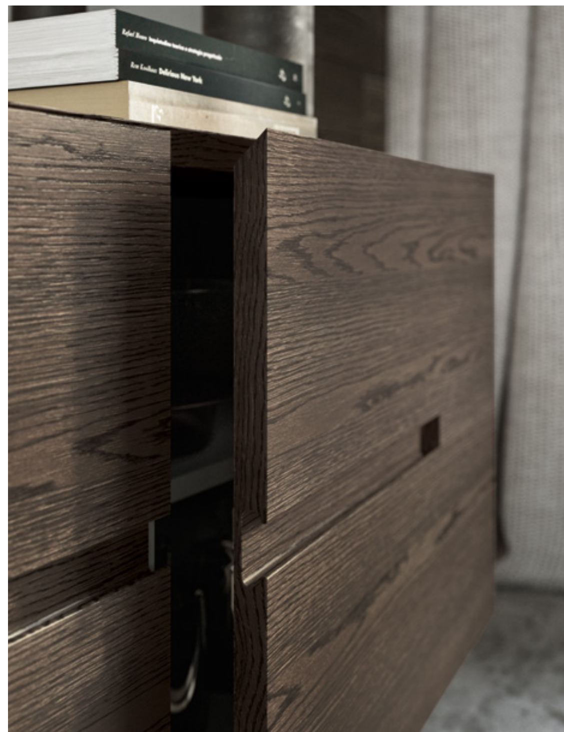
Rovere Carbone Opaco W51 - Laccato True Tortora Opaco 410