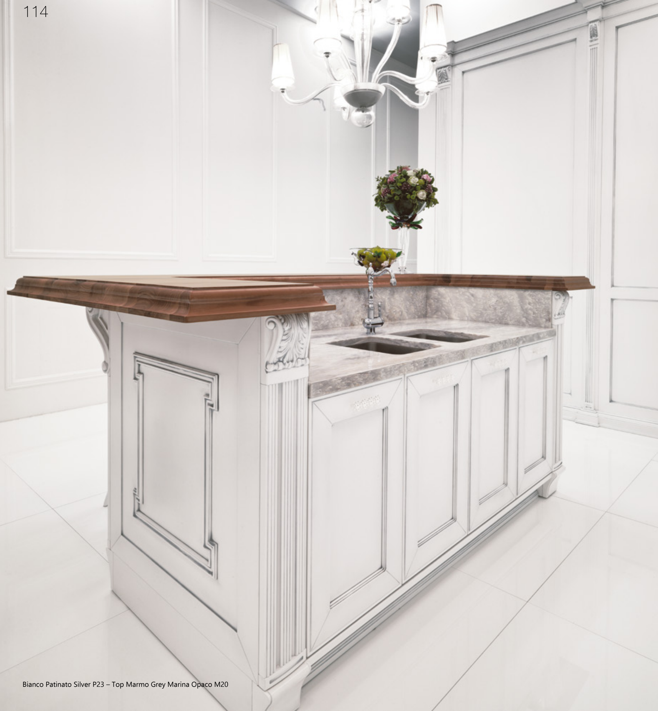
Bianco Patinato Silver P23 – Top Marmo Grey Marina Opaco M20