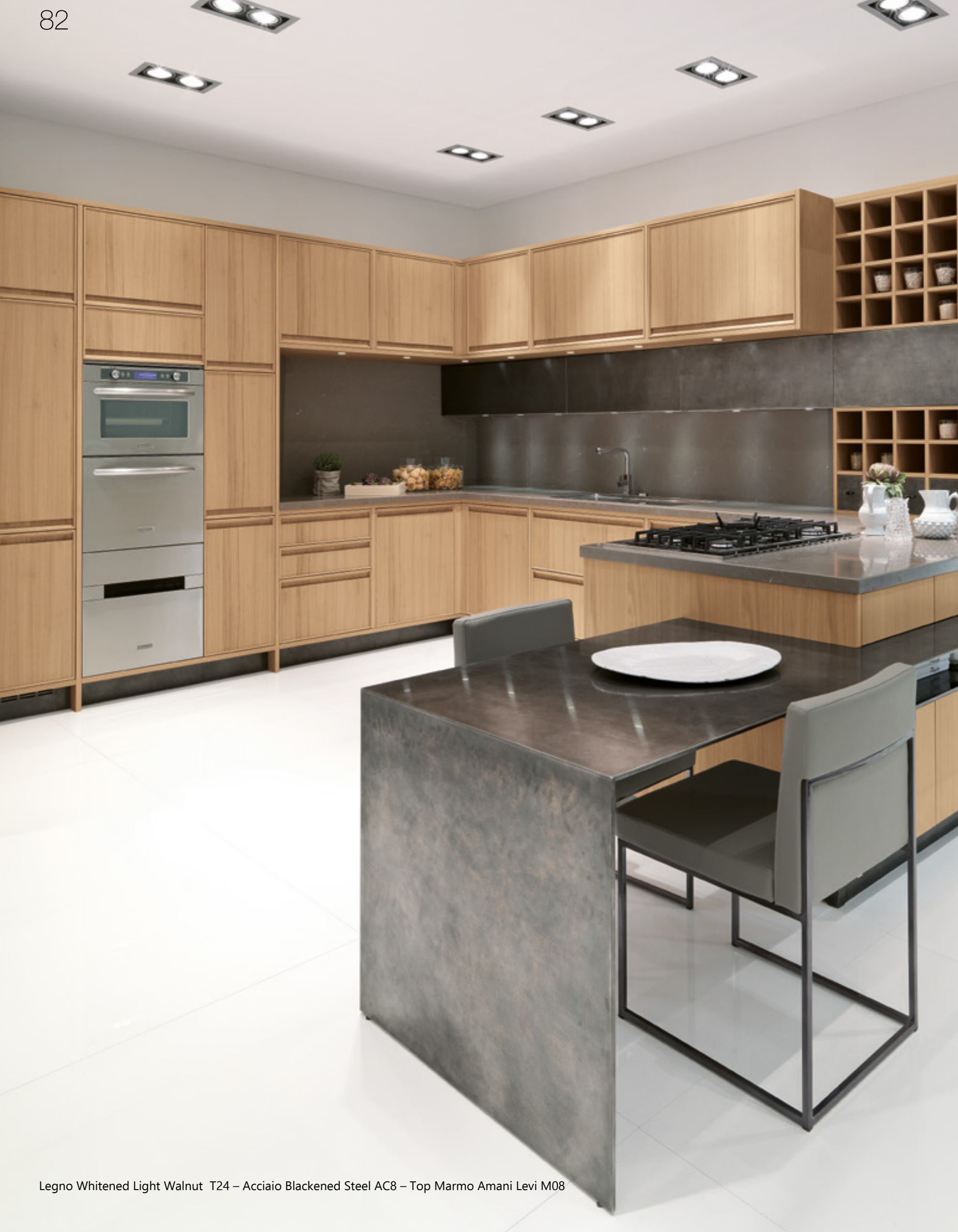
Legno Whitened Light Walnut T24 – Acciaio Blackened Steel AC8 – Top Marmo Amani Levi M08