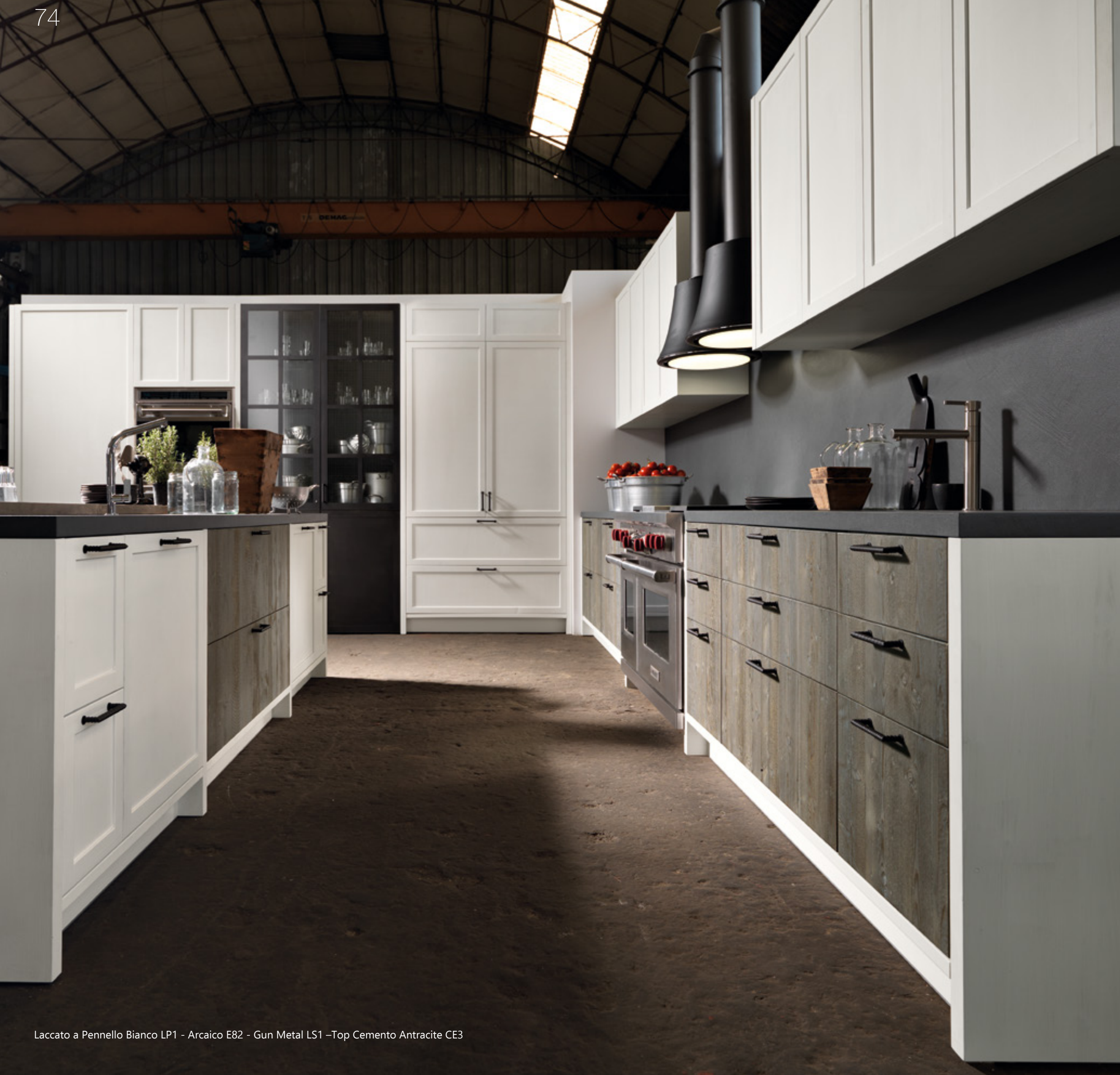
Laccato a Pennello Bianco LP1 - Arcaico E82 - Gun Metal LS1 -Top Cemento Antracite CE3