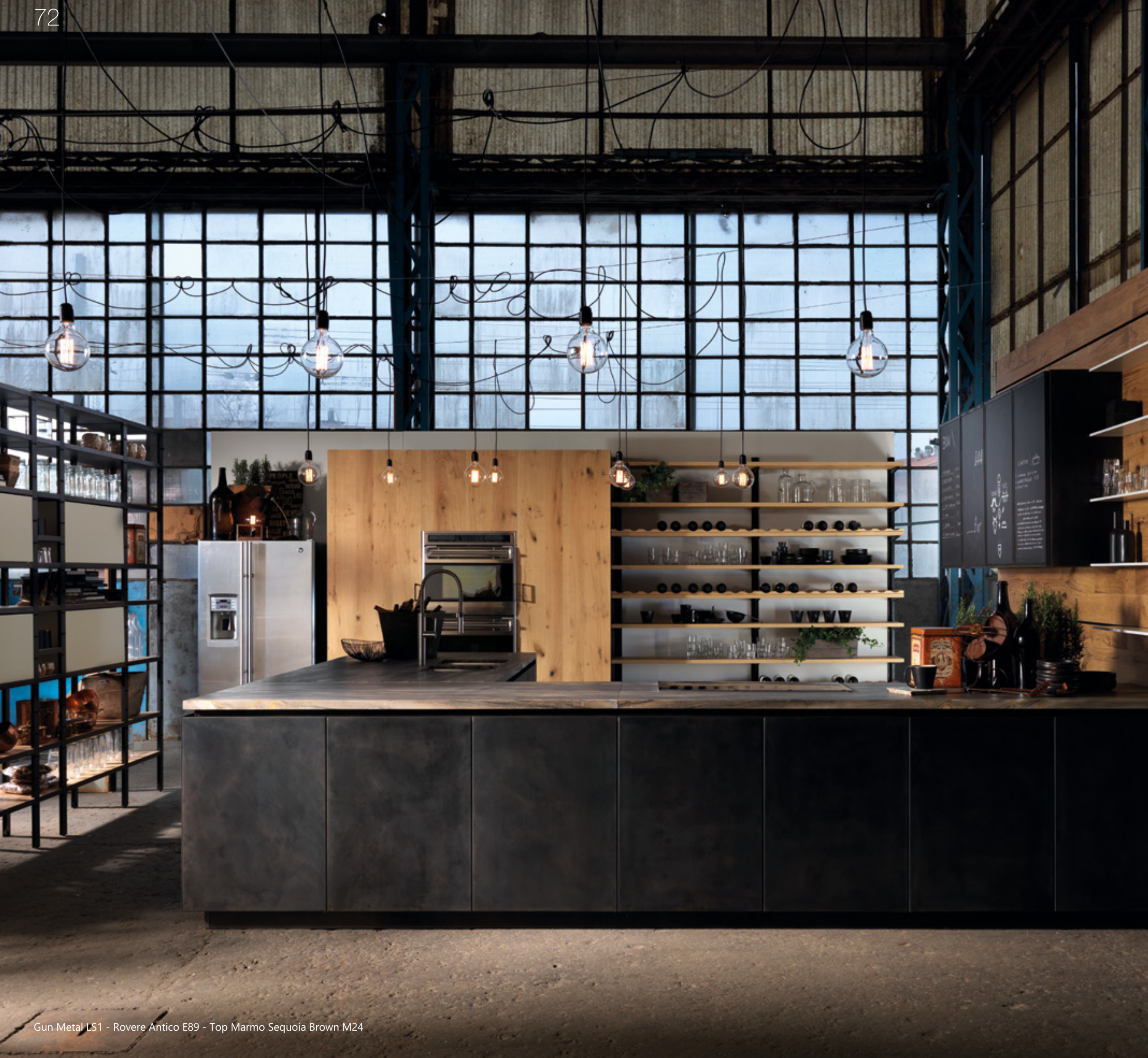
Gun Metal LS1 - Rovere Antico E89 - Top Marmo Sequoia Brown M24